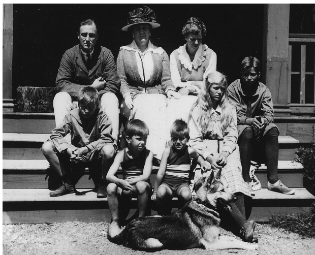
Френклин Д. Рузвелт са породицом у Кампобелу 1920. године 11

Била је све присутнија у животима супружника, чак се и преселила у Бостон да би била са њима, доминирајући над Елеонор. 105 Наводи се да је брак Рузвелтових касније опстао само из интереса. Блискост и брак са Елеонор био је и пут до Тедија Рузвелта јер је она била његова омиљена нећака, ћерка његовог рођеног брата Елиота. 106 Френклин Рузвелт и Елеонор су били даљи рођаци.